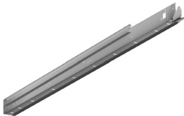
Угловая стойка, состоящая из цельного профиля (НКИ-114, 115)