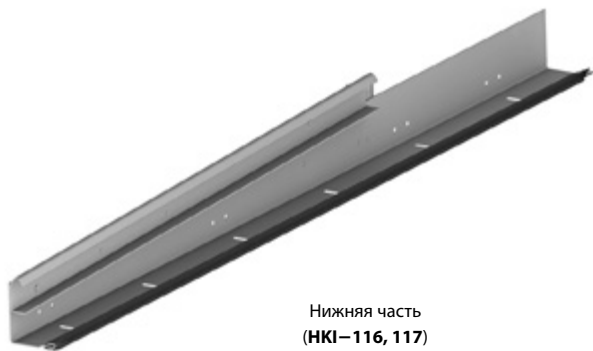
Нижняя часть (НКИ-116, 117)