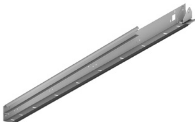
Угловая стойка, состоящая из цельного профиля (НКI-108, 109)