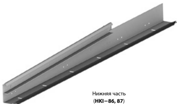
Нижняя часть (HKI-86, 87)