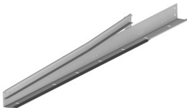
Угловая стойка, состоящая из цельного профиля (HKI-92,93)