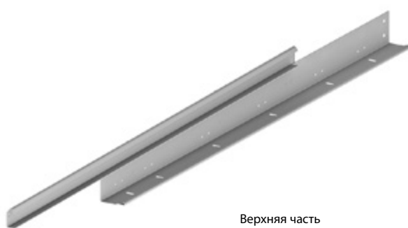
Верхняя часть (HKI-88, 89)