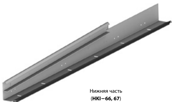
Нижняя часть (HKI-66, 67)