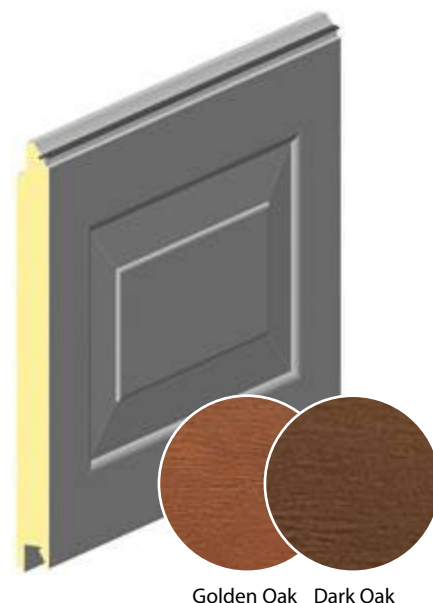
Golden Oak Dark Oak