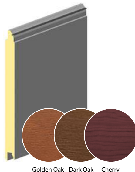
Golden Oak Dark Oak Cherry