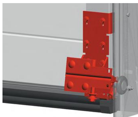
Кронштейн нижний для промышленных ворот