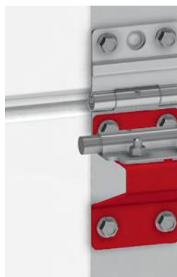
Кронштейн боковой для промышленных ворот